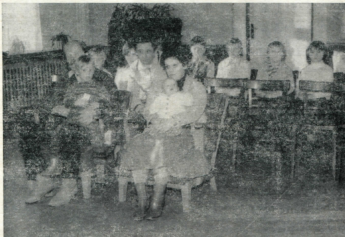
Z posledního vítání občánků